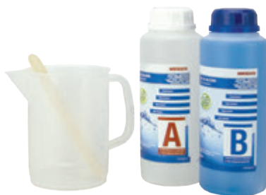
Gel bi-composant en bouteille 1l (N707)