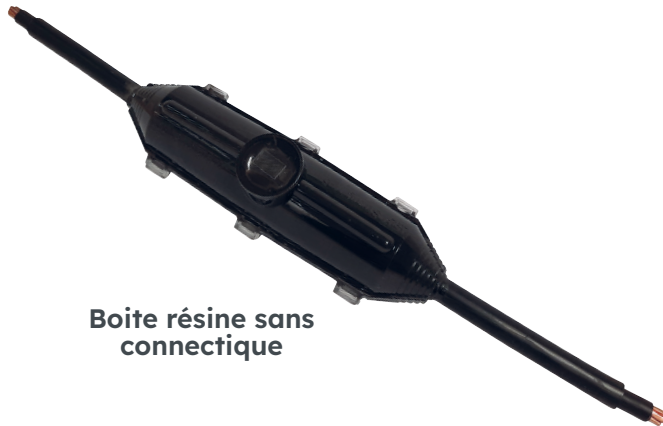
Boite résine sans connectique