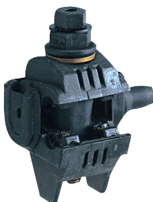
Connecteur de branchement