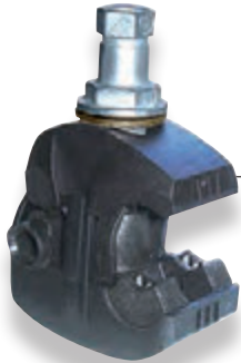
Connecteur d'éclairage public