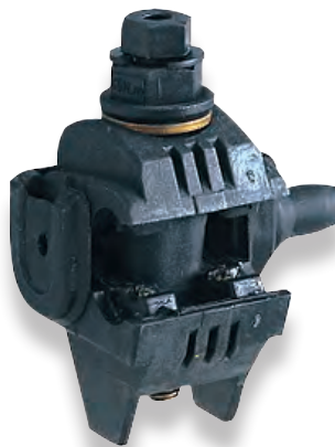
Connecteur de branchement