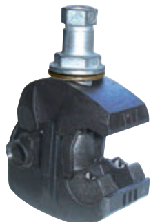
Connecteur d'éclairage public