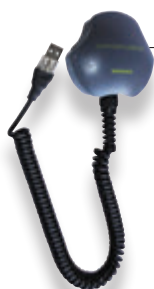
Coupleur USB relève (GA003)