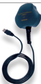
Coupleur USB (P267)