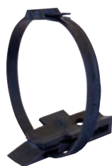
Berceau isolant BIC