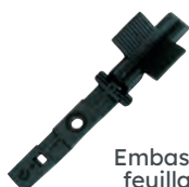
Embase à feuillard