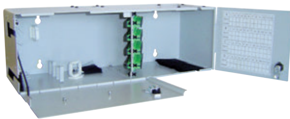
PRI abonné standardisé 48 FO (N243)