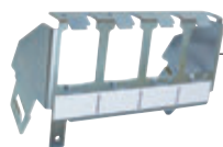
Support 4 RJ45 (LB017)