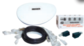
Kit box en ambiance 100 Mbit (LB015)

La box n'importe où, les médias partout !