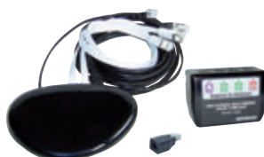
Kit box en ambiance 1 Gbit (LB016)

Les kits box en ambiance permettent l'installation de la box de l'opérateur de communication sur n'importe quelle prise RJ45 du logement.