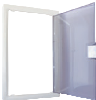
Habillage zone attenante (LB012)

Les habillages NÉO donnent une apparence moderne de mini-baie de brassage résidentielle au tableau de communication tout en le protégeant.