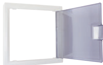
Habillage TDC principal (LB011)